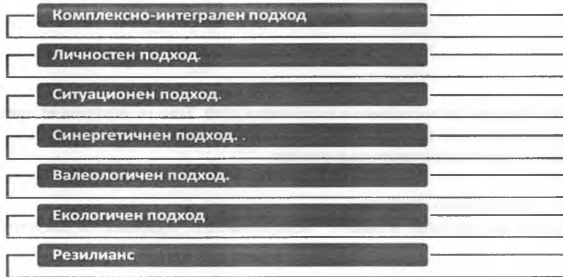
Фигура № 2

а/ Комплексно-интегрален подход. Философска основа на комплексно-интегралния подход се явява учението за всеобщата връзка, която предполага диалектическо единство на цялото към частите, на общото към единичното.