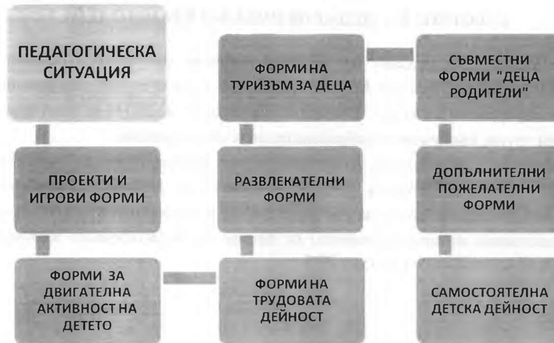
Фигура № 4

Различните форми трябва да гарантират резултати в следните посоки: